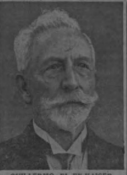
GUILLERMO, EL EX-KAISER

LONDRES, 11. — Por fin, el ex-Kaiser Wilhem, ha vuelto a hablar. Desde el palacio de su exilio en Doorn, el ex-Emperador dijo que si Alemania quiere restaurar la monarquía, su familia no renunciaba a sus derechos. Esta declaración la hizo durante una entrevista concedida a Randolph P. Churchill,